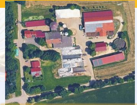
Bauernhof Fam. Groß, Heroldstatt-Sontheim

Bitte pünktlich um 9.45 Uhr zum Einblasen da sein